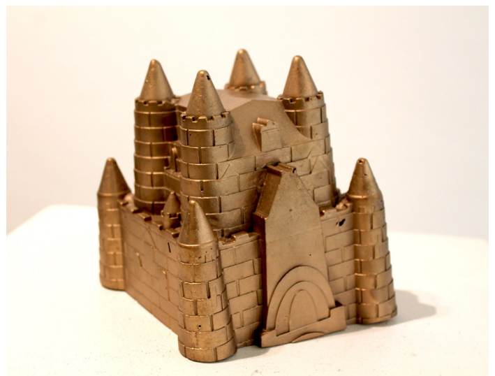
XAVI MUÑOZ, Castle . 2022. Bronce

Para imágenes o más información, contactar al (+34) 629 331 386 o galeria@lbcontemporaryart.com Horario: Lunes - Viernes de 9.30 ha 14.30 hy (con cita previa) de 16 ha 19 h. Sábados de 11 a 14 h.