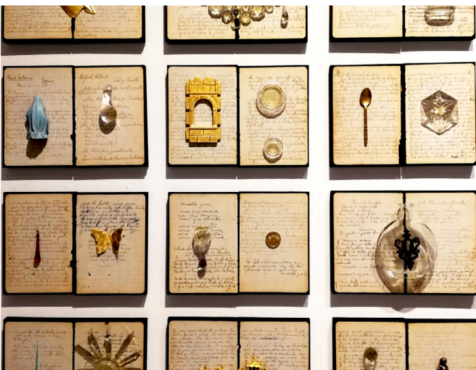
XAVI MUÑOZ, LECTURAS DE UN POETA . 2021. Técnica mixta. Medidas variables. 64 piezas

Muñoz atraviesa la superficie craquelada de su realidad para sumergirnos entre sus fisuras hasta lo más profundo: allí donde residen sus ansias de visibilizar todas sus visiones respirables.